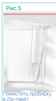
Поместить пробирку в Zip-пакет