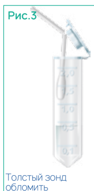
Толстый зонд обломить