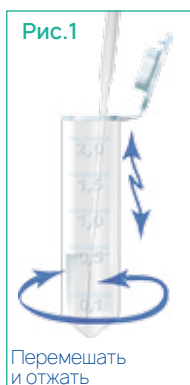
Перемешать и отжать