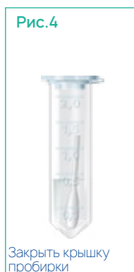
Закрывать крышку пробирки